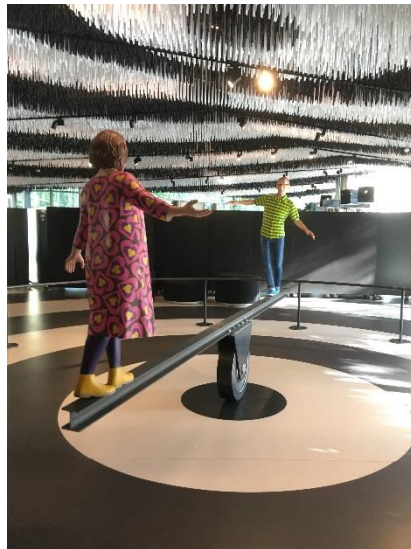
Bild 8: eine junge und moderne Gesellschaft, die Traditionen pflegt und die Moderne lebt