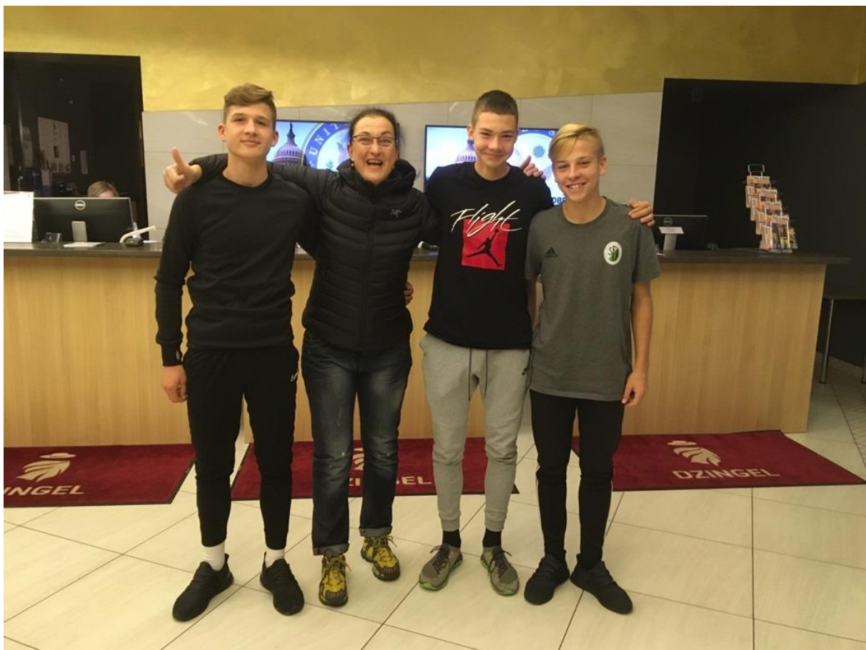
Bild 1: Treff im Hotel Dzingel in Tallinn am Vorabend des Hinspiels

Konzentriert und ruhig haben die Jungs am Vorabend (trotz Champions – Leaguespiel, aber es war ja Halbzeitpause!) sich mit mir über ihre persönlichen Ziel für das Spiel, die körperliche Verfassung und die Vorbereitungen vor Ort im Team Deutschland unterhalten. Dieses war zusammengestellt aus den besten Spielern aller Proficlubs in Sachsen. Ihr Plan war klar: Sieg! Und das klappte solide nicht nur im Hin-, sondern auch im Rückspiel, trotz ergiebiger Regenfälle in diesen Tagen. Am Ende hieß es 2:0 im Hin-, 3:1 Endstand im Rückspiel. Glückwunsch!